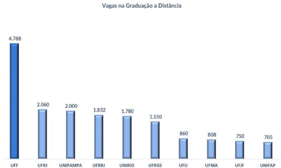
Gráfico 2 - Vagas na Graduação à Distância.