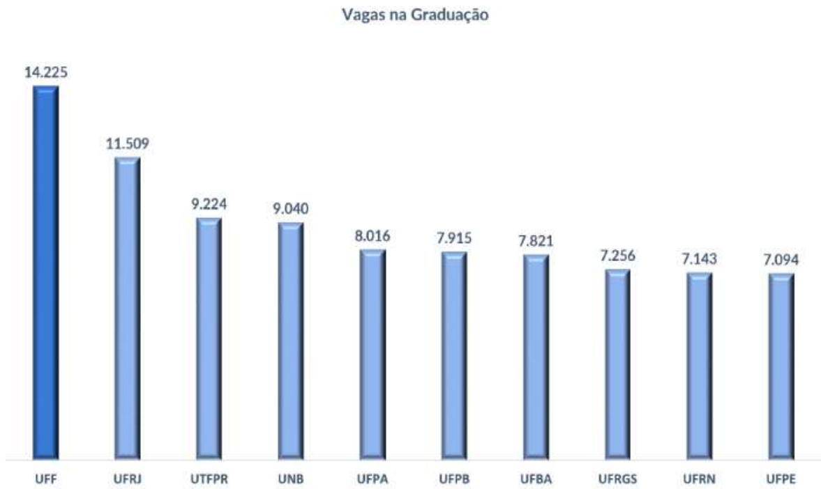
Gráfico 1 - Vagas na Graduação. Fonte: Censo da Educação Superior 2018.